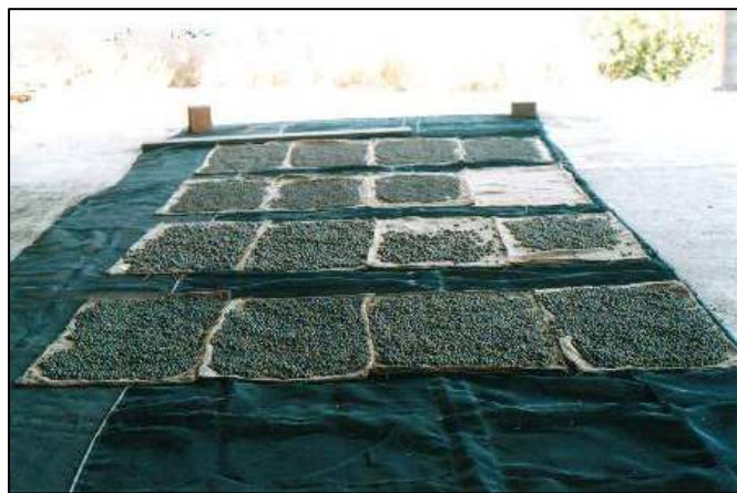
Boles d'argila assecant-se

A part de boles també hem estat practicant una altra manera de recobrir les llavors amb argila, fent uns tacos .