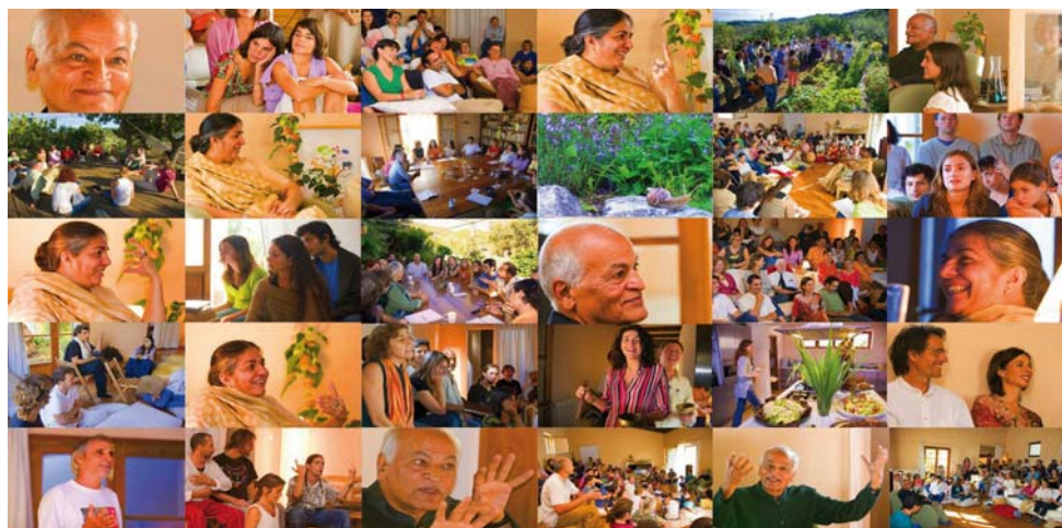
Collage del Encuentro Tierra, Alma y Sociedad

digo que el mundo es bello tal y como es, el mundo es maravilloso, pero en el mundo hemos desarrollado unas instituciones y estas necesitan ser renovadas. Del mismo modo en que mi casa es mi amiga, pero la tengo que limpiar, y de vez en cuando tengo que hacer reparaciones, y después de un tiempo tengo que pintarla porque se desgasta y necesita renovaciones. Del mismo modo, la política necesita reparaciones y renovaciones. Entonces yo apporto transformación y renovación a la política. La economía necesita ser renovada, entonces yo trabajo para que haya renovaciones en la economía. Los sistemas agrícolas necesitan renovaciones porque se han vuelto obsoletos. Entonces traigo reparación y renovación a los sistemas agrícolas. Todo es por amor, no juzgo, no critico.